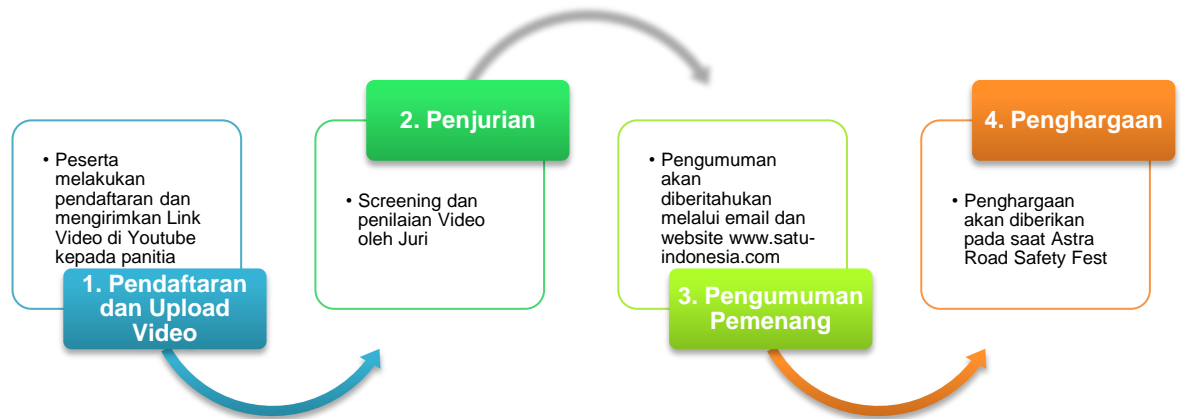
Bagan 2 Tahapan Astra Road Safety Video Competition